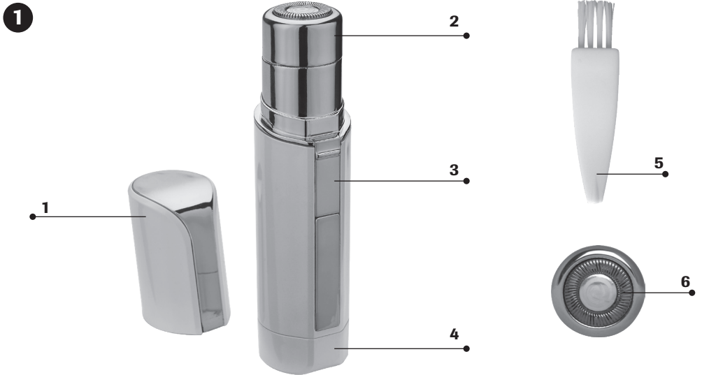
Abbildung | Illustration | Figure | Figura | Afbeelding | Ábra | Obrázek | Obrázok | Figura | Rysunek | Resim | Figura